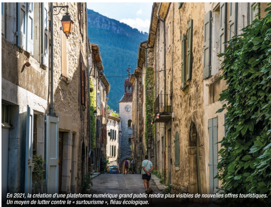
En 2021, la création d'une plateforme numérique grand public rendra plus visibles de nouvelles offres touristiques. Un moyen de lutter contre le « surtourisme », fléau écologique.

C'est la part des PGE (prêts garantis par l'État) octroyés à la filière tourisme, celle qui y a eu le plus recours.