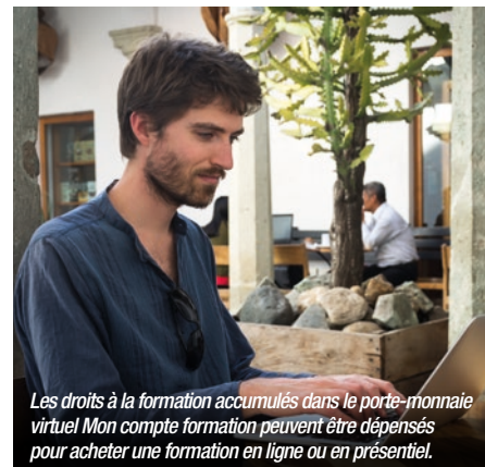
Les droits à la formation accumulés dans le porte-monnaie virtuel Mon compte formation peuvent être dépensés pour acheter une formation en ligne ou en présentiel.

qui complète leurs droits acquis au titre de l'activité professionnelle. Cette rallonge peut aider les salariés à couvrir le coût d'une formation, les inciter à se former ou à mettre à jour leurs connaissances, via www.moncompteformation.gouv.fr . Les demandeurs d'emploi peuvent, quant à eux, solliciter Pôle emploi pour demander un financement complémentaire de leur projet de formation. Un portail destiné aux entreprises et financeurs répertorie toutes les informations utiles sur les abondements : www.financeurs.moncompteformation.gouv.fr/employeurs . Il dispense aussi des conseils sur l'accompagnement des salariés dans la mobilisation de leurs droits à la formation.