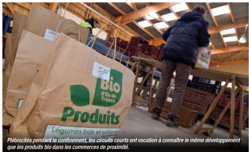
Plébiscités pendant le confinement, les circuits courts ont vocation à connaître le même développement que les produits bio dans les commerces de proximité.