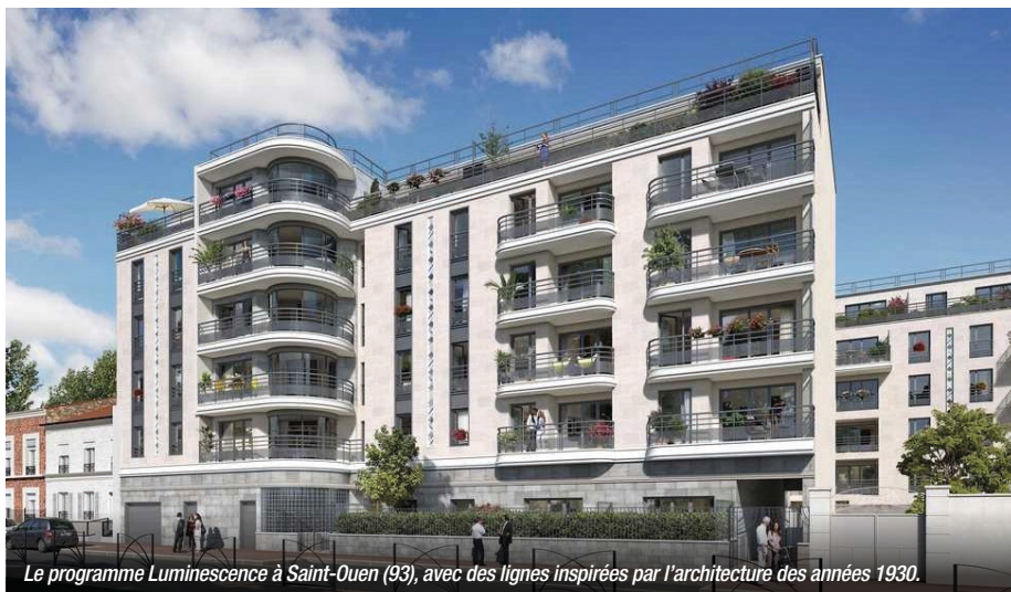
Le programme Luminescence à Saint-Ouen (93), avec des lignes inspirées par l'architecture des années 1930.

Huit cent cinq logements abordables contractualisés, mais aussi 198 logements locatifs intermédiaires et 88 logements locatifs sociaux : c'est ce que prévoit l'accord pour une vente en l'état futur d'achèvement (VEFA) passé entre CDC Habitat et Icade Promotion. Ces logements sont répartis dans 40 programmes immobiliers à travers la France et correspondent à environ 25 % du stock commercial d'Icade Promotion. L'accord signé entre Icade Promotion et CDC Habitat, qui représente un chiffre d'affaires de plus de 208 millions d'euros, « participe pleinement à la réalisation des objectifs de réservation annuels d'Icade Promotion, objectifs maintenus malgré le contexte de crise sanitaire », précise Olivier Wigniolle, directeur général