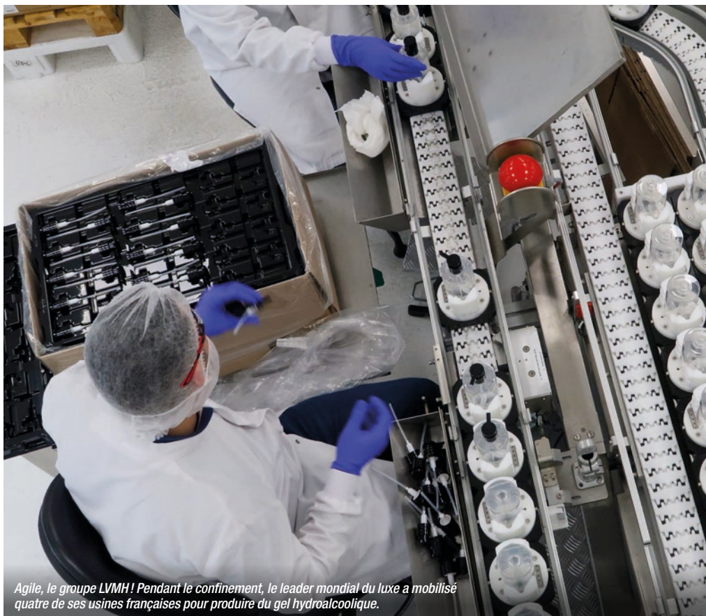
Agile, le groupe LVMH ! Pendant le confinement, le leader mondial du luxe a mobilisé quatre de ses usines françaises pour produire du gel hydroalcoolique.

Autre annonce destinée aux Territoires d'industrie et aux villes Action cœur de ville :