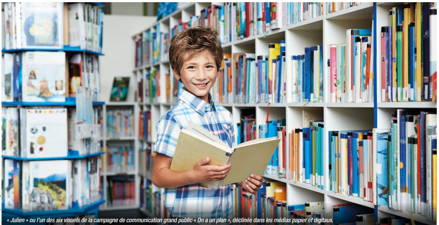
« Julien » ou l'un des six visuels de la campagne de communication grand public « On a un plan », déclinée dans les médias papier et digitaux.

Le Groupe, qui participe activement à l'effort de relance de la production de logements, a lancé un appel à projets pour la construction de 40 000 logements sociaux et intermédiaires, via CDC Habitat. Par ailleurs, la crise a confirmé la nécessité de renforcer les actions à destination des travailleurs essentiels, comme les personnels soignants : des logements situés à proximité immédiate des hôpitaux leur seront donc réservés.