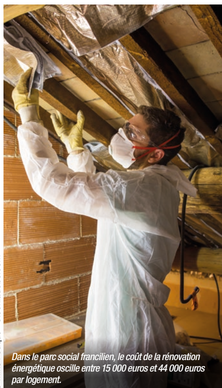
Dans le parc social francilien, le coût de la rénovation énergétique oscille entre 15 000 euros et 44 000 euros par logement.

La signature des actes de vente est prévue pour le deuxième semestre 2020 et l'année 2021.