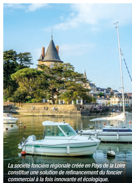
La société foncière régionale créée en Pays de la Loire constitue une solution de refinancement du foncier commercial à la fois innovante et écologique.

Celle-ci réalisera la rénovation énergétique des murs acquis. Les entreprises bénéficieront d'une option de rachat. Cette solution de refinancement, innovante et écologique, mobilise 11 M€ : 5 M€ de la Région, 5 M€ de la Banque des Territoires et 1 M€ de la Caisse d'Épargne. En complément, les dirigeants recourant à la société foncière pourront bénéficier d'un accompagnement sur-mesure et d'un parcours de transformation de leur modèle économique via l'agence économique de la Région, Solutions&Co.