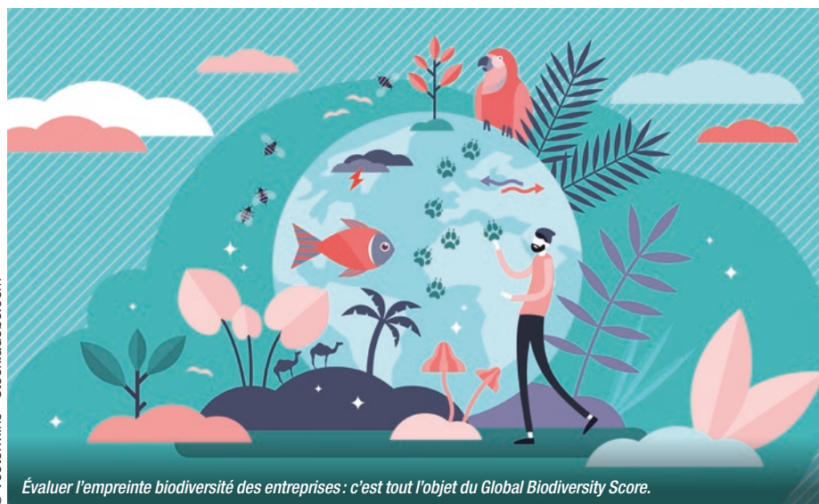
Évaluer l'empreinte biodiversité des entreprises : c'est tout l'objet du Global Biodiversity Score.

La première version du Global Biodiversity Score (GBS), outil de mesure d'empreinte biodiversité, a été lancée par CDC Biodiversité et le Club des entreprises pour une biodiversité positive (Club B4B+*).