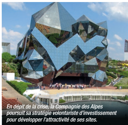
En dépit de la crise, la Compagnie des Alpes poursuit sa stratégie volontariste d'investissement pour développer l'attractivité de ses sites.

À proximité immédiate, une extension, le Futuroscope 2, intégrera deux hôtels à thème et un parc aquatique. Son coût : 104 M€ d'investissements, portés par